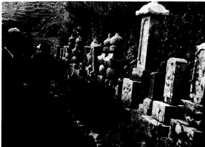
コドウの高橋家墓地

しかし、新墓地は狭隘のため、間もなく埋葬の余地がなくなり、墓参にも不便が多かった。そこで、昭和年代に入ると、火葬をして旧墓地に埋葬することが通例となった。