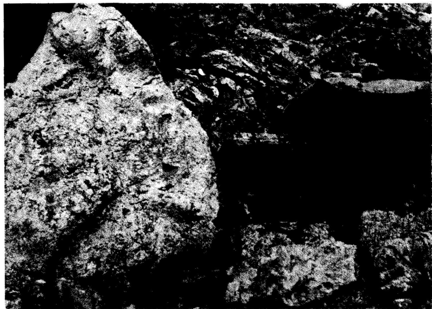
竜王、蛭子祠・尺間祠