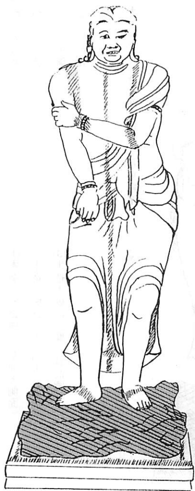
木造 不動三尊立像 脇侍 制吒迦童子 正面圖