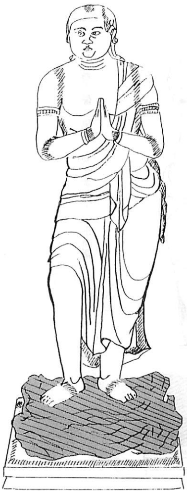
木造 不動三尊立像 脇侍 矜羯羅童子 正面圖

(1) 木造大威德明王(左前方側面) (2) 木造大威德明王(右前方側面) (3) 木造不動明王像 背面圖