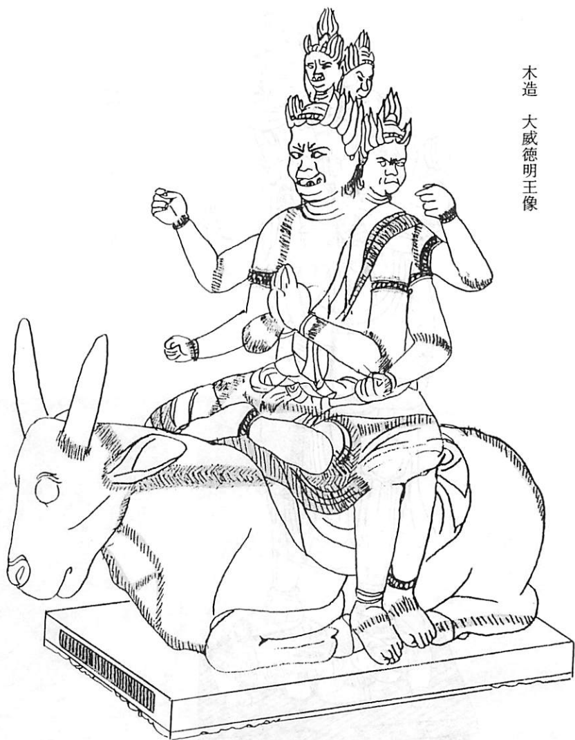
木造 大威德明王像